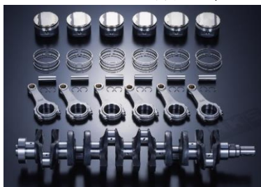
2JZ-GTE 3.4L KIT